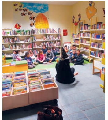
Escape game (20/01/2023)