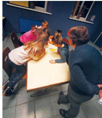
Escape game (20/01/2023)