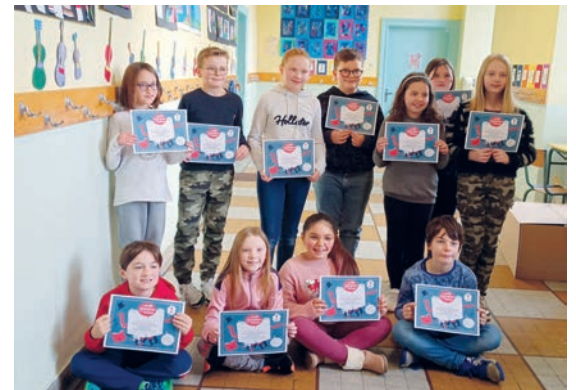
Champion de lecture CM2 (19/01/2023)