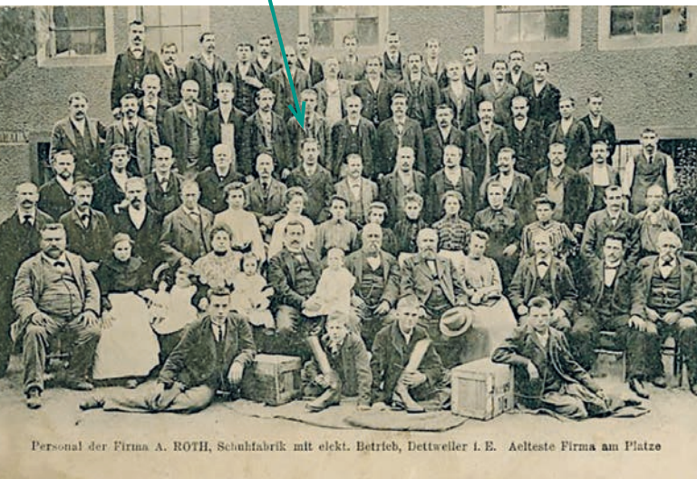
Personal der Firma A. ROTH, Schuhfabrik mit elektr. Betrieb, Dettweiler i. E. Aelteste Firma am Platze