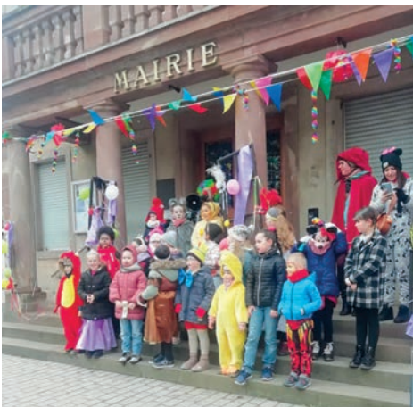
Carnaval de La Liberté (26/02/2023)