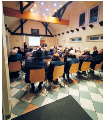
Réunion centrale villageoise (01/02/2023)