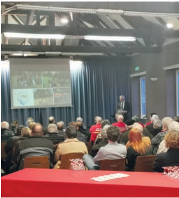
Voeux du maire (15/01/2023)