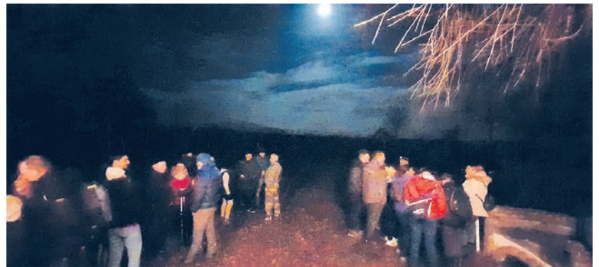
Marche de nuit (04/02/2023)