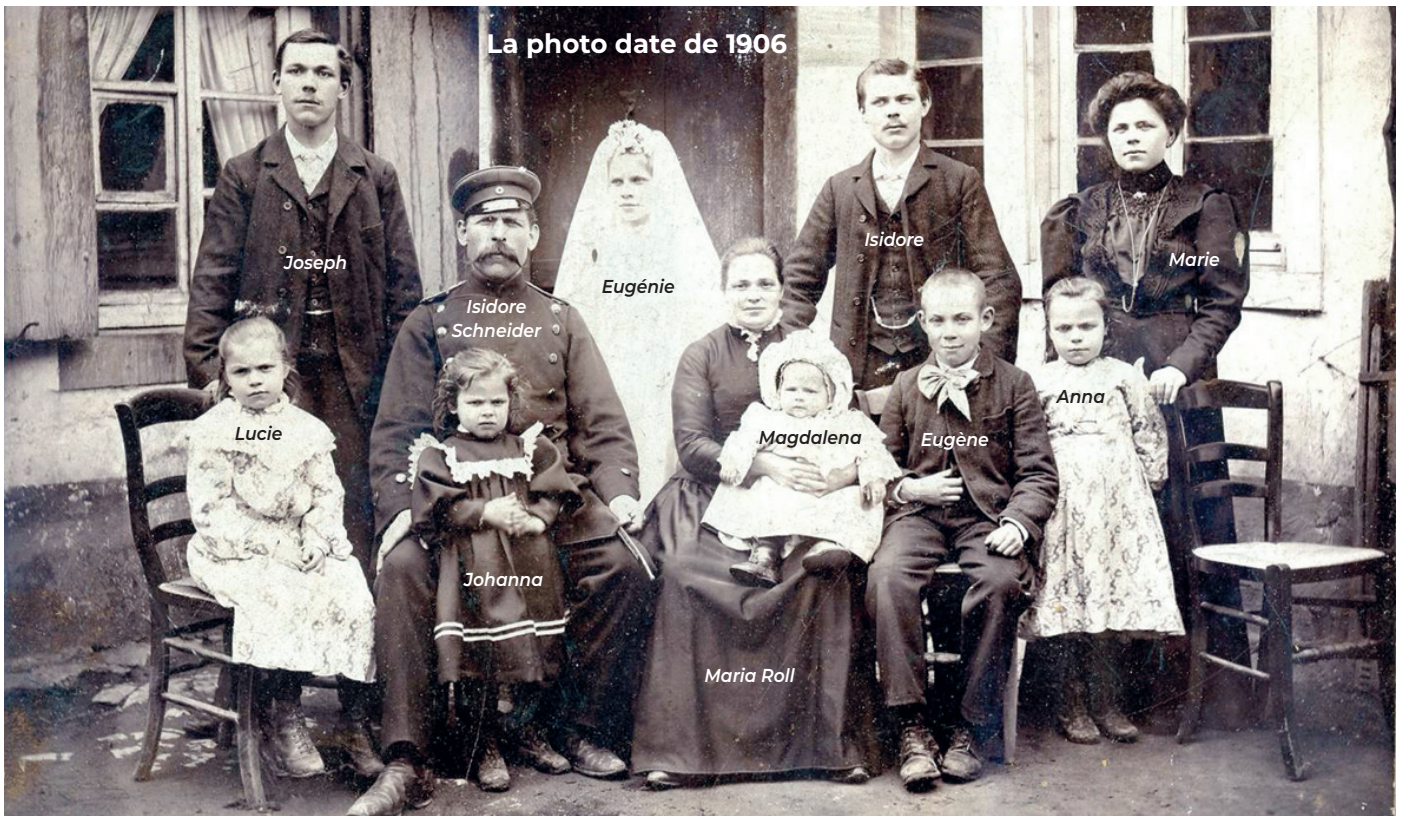
La photo date de 1906