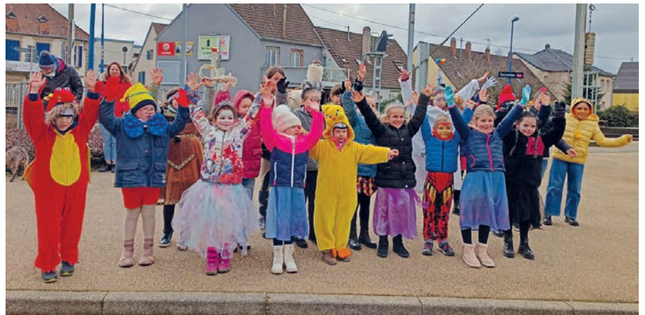
Carnaval de La Liberté (26/02/2023)