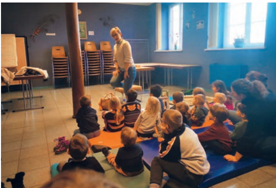
Bébé lecteur (18/01/2023)