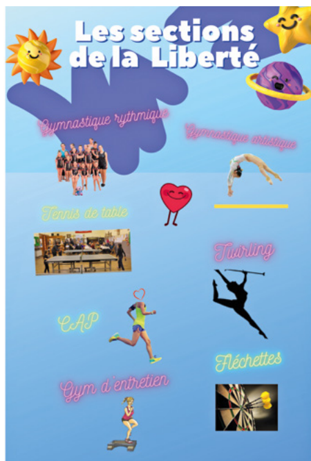
PLANNING des DIFFÉRENTES SECTIONS de la LIBERTÉ