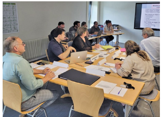
Première mise en situation de la cellule de crise avec un cas de crise «incendie» fictif rassemblant l'ensemble des experts

Une analyse des risques a été menée sur les 35 communes du territoire, permettant d'identifier les principaux aléas et enjeux. Ce diagnostic, complété par un inventaire des moyens disponibles, renforce la capacité de la cellule de crise intercommunale à coordonner les opérations nécessaires et à apporter un soutien efficace aux communes touchées.